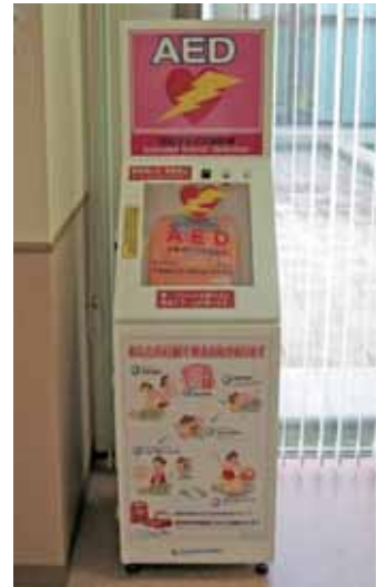
(当院外来ロビー設置)

平均で約6分を要するが、心停止した場合一刻も早く電氣的除細動を施行することが必要とされており、6分も待つ余裕は全くありません。救急車の到着以前に AED を使用した場合には、救急隊や医師が駆けつけてから AED を使用するよりも、救命率が数倍も高いことが明らかになっていま