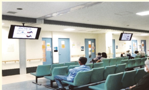
外来待合にて動画放送