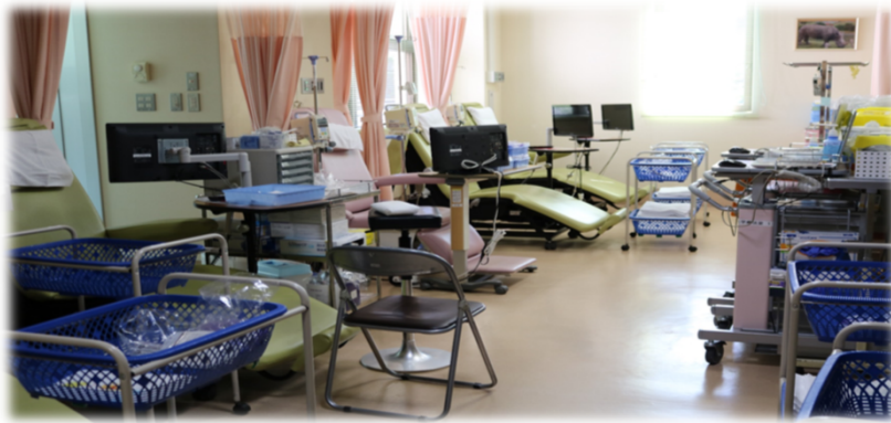
写真：外来薬物療法室

抗がん剤治療は外来通院で行うことが多くなっています。外来通院になってからも看護師がサポートいたしますのでご安心ください。抗がん剤治療を受ける患者さんからご相談が多い内容を紹介します。